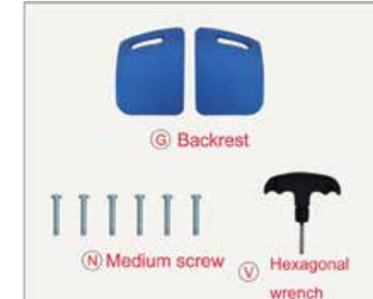
36. Izņemiet visus iepriekš minētos piederumus.