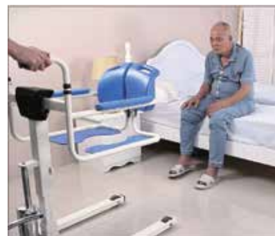
1. Piestumiet un pagrieziet iekārtu gultas virzienā.