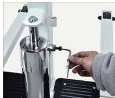
32. Ar uzgriežņu atslēgu ievietojiet hidrauliskā cilindra skrūvi.