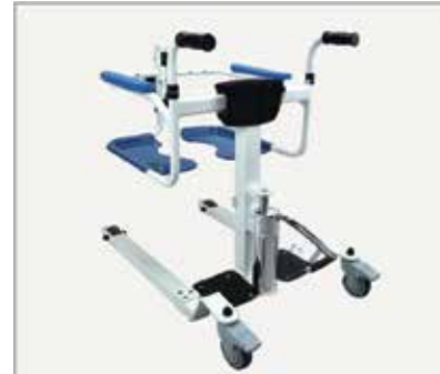
35. Attēls pēc hidrauliskā cilindra uzstādīšanas pabeigšanas.