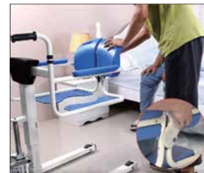
2. Atveriet drošības sprādzi.