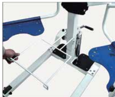
40. Ievietojiet to galvenā rāmja atverēs.