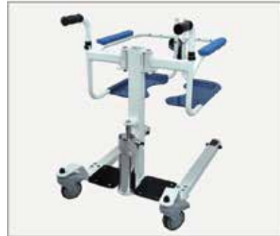
28. Rokturu uzstādīšana ir pabeigta.