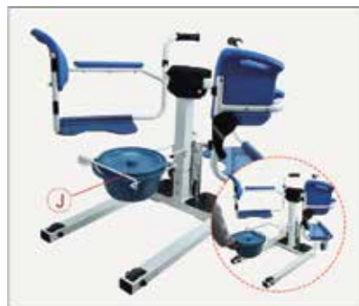
41. Uzlieciet spaini uz rāmja.