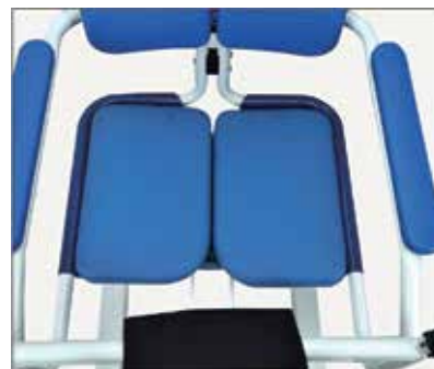
45. Galveno rāmi var aprīkot arī ar mīkstiem sēdekļiem.