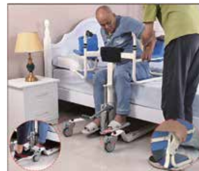
3. Ar kājām nospiediet bremzes, atveriet drošības sprādzi un palīdziet nosēsties uz sēdekļa. Pēc tam aizveriet drošības sprādzi.