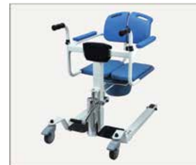
46. Visas iekārtas pilnīga uzstādīšana ir pabeigta.