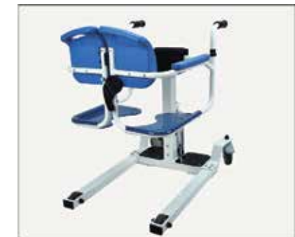
38. Atzveltnes uzstādīšana ir pabeigta.