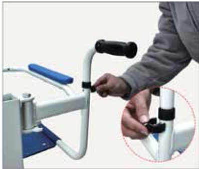
27. Pievienojiet sprādzi, lai to nostiprinātu.