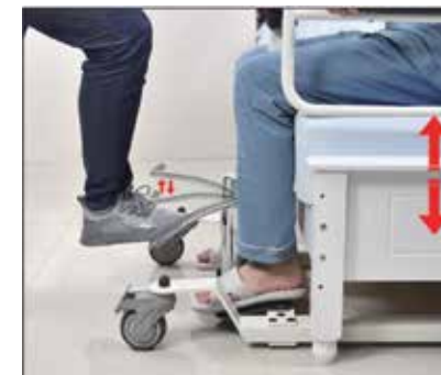
4. Pielāgojiet augstumu, viegli uzspiežot ar pēdu uz hidrauliskā cilindra rokturi. Nespiediet uz tā stipri, jo tas samazinās augstumu (Atgādinājums: pacelšanas laikā tikai viegli uzkāpiet uz tā, lai izvairītos no pacelšanas funkcijas kļūmēm).