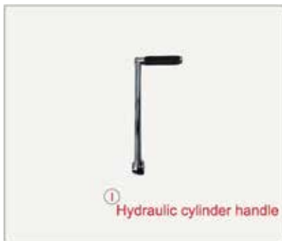
31. Izņemiet hidrauliskā cilindra rokturi.