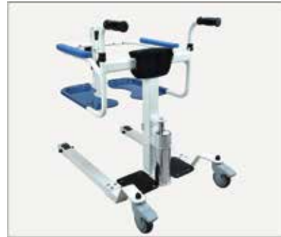
30. Uzglabāšanas somiņas uzstādīšana ir pabeigta.