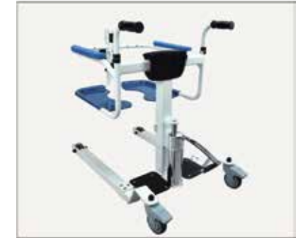
34. Hidrauliskā cilindra uzstādīšana ir pabeigta.