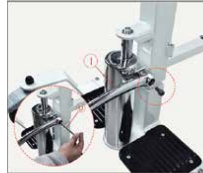
33. Nostipriniet hidrauliskā cilindra rokturi atbilstošā leņķī un nofiksējiet to ar iepriekš ievietotajām skrūvēm. Pēc tam pievelciet tās ar sešstūra formas uzgriežņu atslēgu.