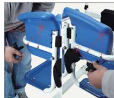
37. Piestipriniet atzveltni pie sēdekļa rāmja caurules, atbilstošajos caurumos nofiksējiet ar vidēji lielajām skrūvēm pēc kārtas. Pievelciet ar sešstūra atslēgu.