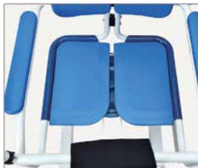
44. Galvenais rāmis ir aprīkots ar cietiem sēdekļiem.