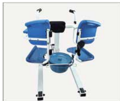
42. Nostiprinot sēdekļa rāmi, pagrieziet savienojuma rokturi, līdz tas ir cieši nofiksēts.