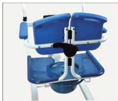
43. Cieši nofiksējiet.