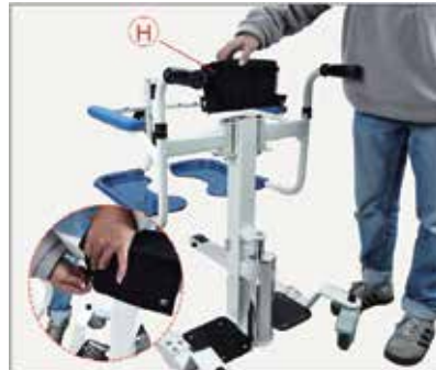
29. Izņemiet uzglabāšanas somiņu, novietojiet to uz galvenā rāmja un nostipriniet.